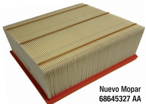
Nuevo Mopar 68645327 AA